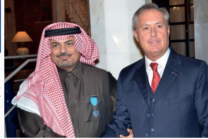
مع معالي السفير الفرنسي بالسعودية عند تسلم وسام فارس من قبل رئيس الجمهورية الفرنسية، الرياض