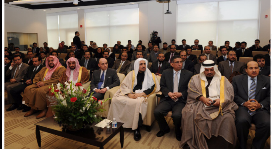
من لقاءات واجتماعات مع معالي وزير العدل بالولايات المتحدة الأمريكية