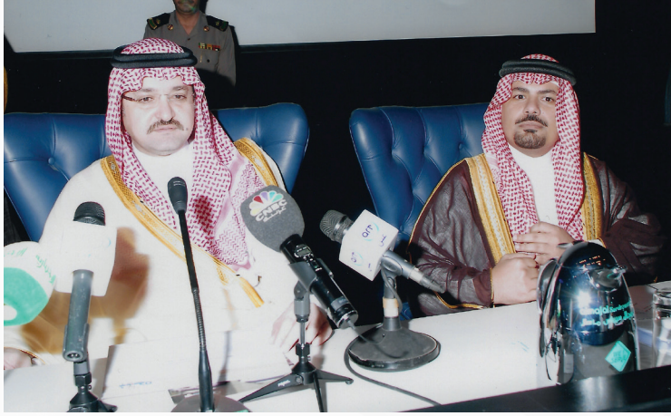
مع صاحب السمو الملكي الأمير مشعل بن ماجد محافظ جدة أثناء افتتاح أعمال ملتقى العقار بين التسجيل والتطوير والتمويل بجدة