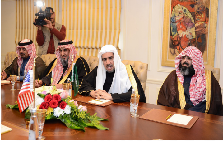
أثناء المشاركة مع معالي وزير العدل في اجتماعات washington D.C, USA