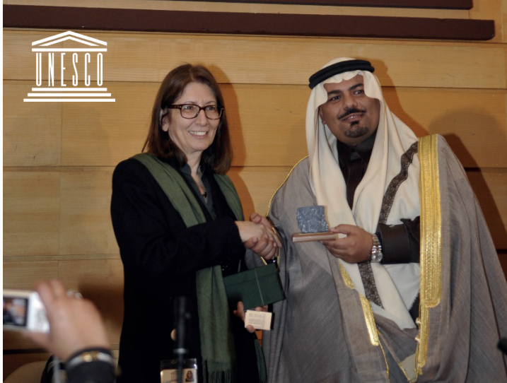
تكرم بمناسبة تقديم محاضرة في اليونسكو بباريس