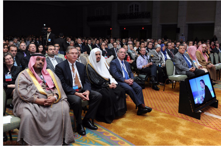
مع معالي وزير العدل كضيف شرف للمؤتمر السنوي للاتحاد الدولي للمحاميين، ميامي، USA