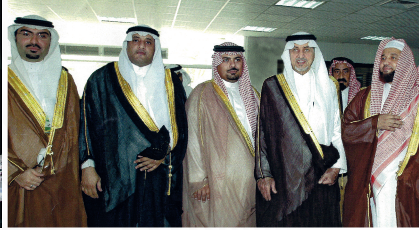
مع صاحب السمو الملكي الأمير خالد الفيصل أثناء تدشين قاعة المحامين بالمحكمة العامة بجدة خلال رئاسة لجنة المحامين بغرفة جدة