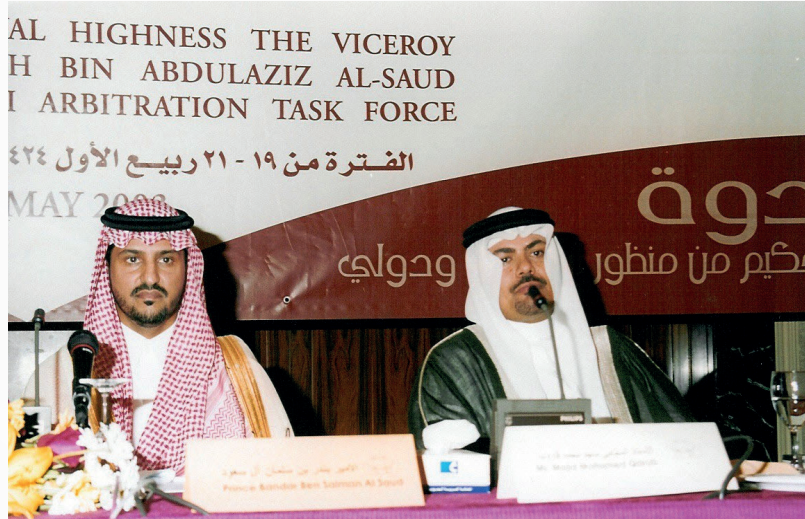
مع الأمير د. بندر بن سلمان رئيس فريق التحكيم السعودي أثناء تدشين مؤتمر التحكيم من منظور إسلامي ودولي بجدة