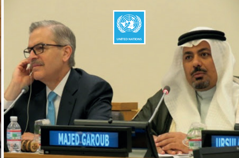
ضمن وفد الاتحاد الدولي للمحامين في الأمم المتحدة بزمالة رئيس الاتحاد السيد ستيفن در بفسوس، جنيف