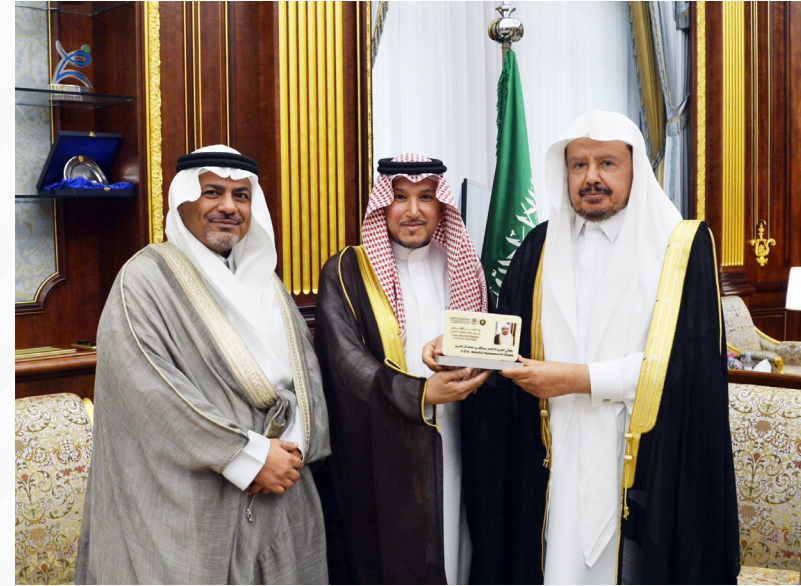
مع معالي رئيس مجلس الشورى د. عبدالله آل الشيخ والأمين العام لمركز التحكيم التجاري لدول مجلس التعاون لدول الخليج العربية أثناء تكملة كأحد رواد العمل القانوني في المملكة العربية السعودية