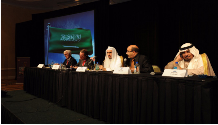
خلال المؤتمر السنوي للاتحاد الدولي للمحاميين الذي كان معالي الشيخ الدكتور محمد بن عبد الكريم العيسى هو ضيف الشرف لمؤتمر في مدينة ميامي الأمريكية