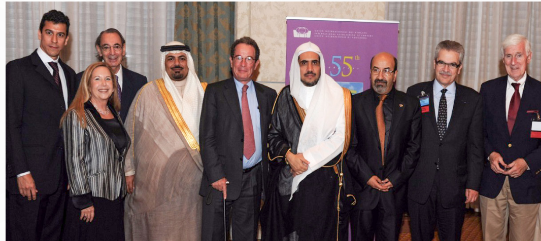
مع معالي وزير العدل بلقاء مع رؤساء وقيادات الاتحاد الدولي للمحامين UIA